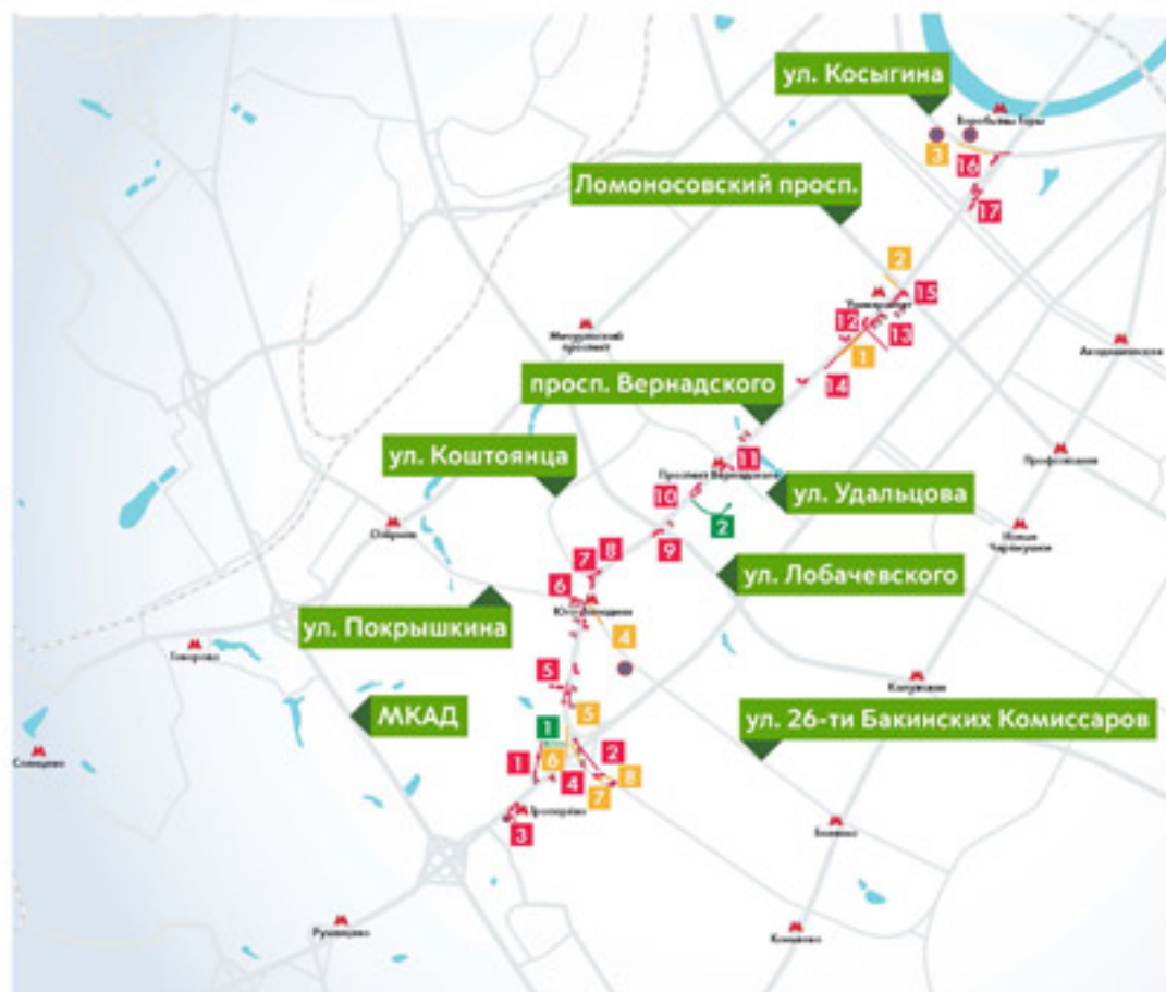
Схема организации дорожного движения при закрытии участка Сокольнической линии